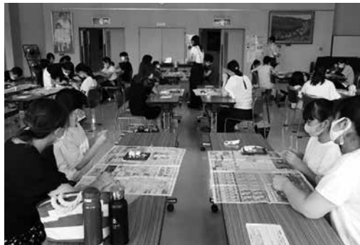
スイーツデコ講座(昨年度の様子)