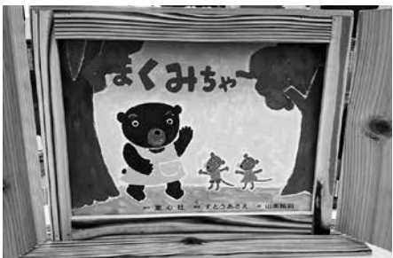
紙芝居の台もあります

安茂里公民館の図書館にない本はリクエストも可能ですのでお気軽にお声掛けください。紙芝居、絵本もありますので、親子でぜひご利用ください。