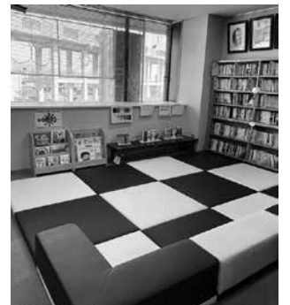
ソファで絵本が読めるようになりました