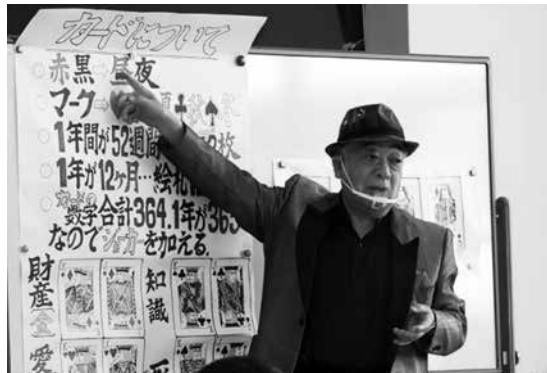
マジック講座(昨年度の様子)