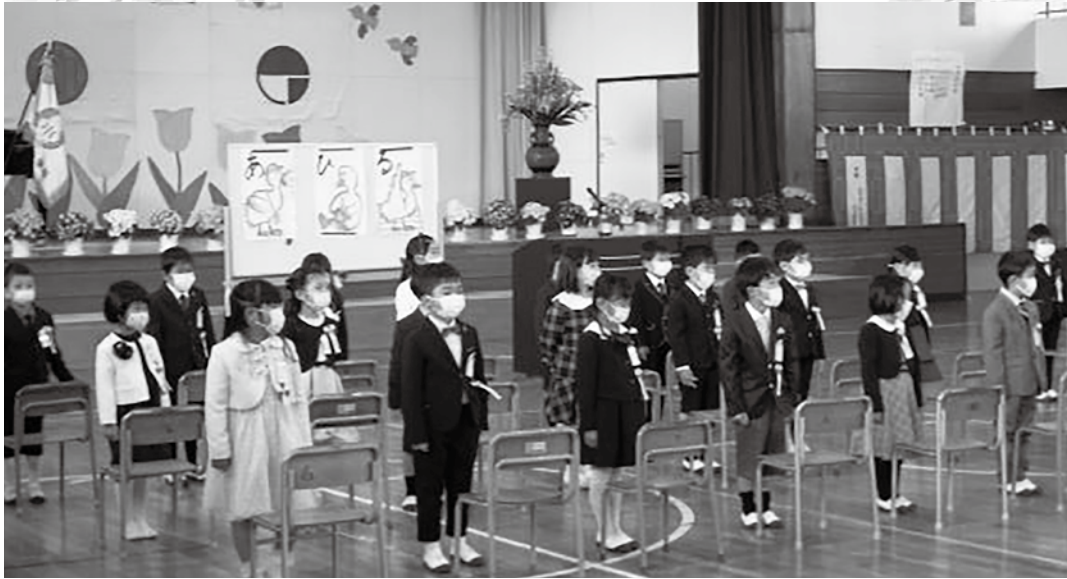
4月6日の安茂里小学校の入学式（2学級 計42人）