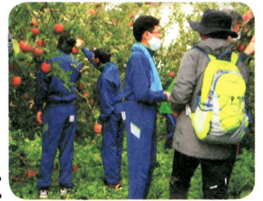
リンゴの葉摘みをする 裾花中学校の生徒たち

10月15日(木)に実施した「リンゴの葉摘み、リンゴ狩り」に参加した裾花中学校の生徒から礼状が届きましたので一部を紹介します。