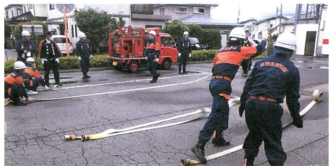
長野市消防団 安茂里分団の訓練

安茂里地区住民自治協議会とのコミュニケーションを一層高め、地域に密着し地元を支える消防活動を遂行していく所存です。