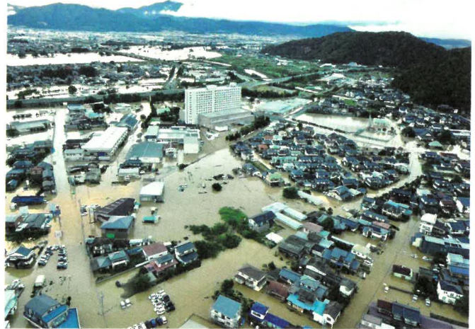
令和元年10月13日(日)台風19号の豪雨により浸水した松代のロイヤルホテル長野付近

一昨年の台風19号災害時における長沼地区住民へのアンケートによりますと、避難時に迷ったことの上位3つは、「どのタイミングで、どこへ、何をもちて避難したらよいか」迷った