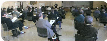
広い空間を設けての講習

新型コロナウイルス感染の危険がある状況下での「災害時における避難方法等に関する講習会」を