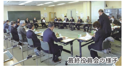
最終役員会の様子

住民自治協議会は、「自助、共助、公助」の補完性の原則をもとに、市と協働しながら、地域の特性を生かしたまちづくりを進めるための住民主体の自治組織です。これを実現するため、「安茂里地区まちづくり計画」に基づき取り組んでいるところであり、今年度の事業も例年どおり計画されていますが、新型コロナウイルス感染防止のため事業が計画どおり進められるのか大変懸念されます。