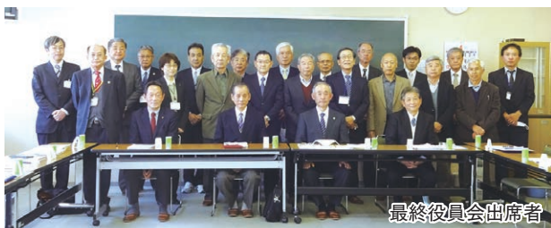
最終役員会出席者

5月14日には緊急事態宣言の対象から長野県が外れたものの、「3密」の回避、マスク着用、手洗いの励行、人との接触機会の減少等に引き続き取り組まなければならない、元通りの日常生活に戻るにはまだまだ時間が必要です。