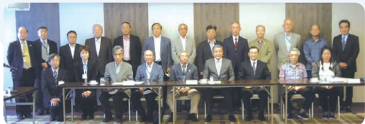
ホテル信濃路で開催された第1回区長会出席者