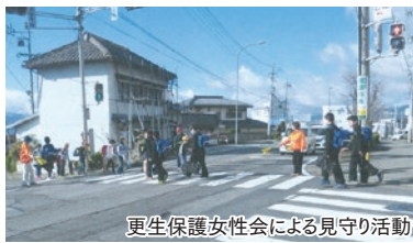
更生保護女性会による見守り活動

又、安茂里小通学区の区長さんを中心に朝夕の見守り隊が発足し、子どもたちの安心安全の為にご尽力いただいております。