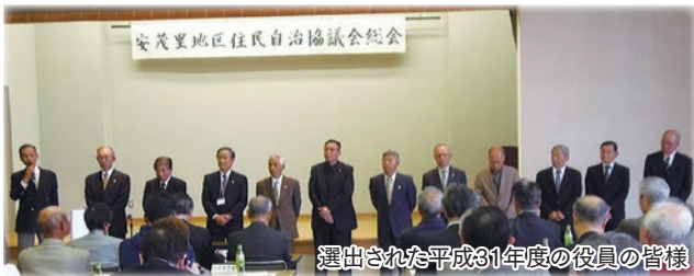
選出された平成31年度の役員の皆様

その主な事業として高齢者や障がいを持っている方・子育てなど地域福祉の充実、安全・安心の環境づくり、また安茂里3大イベントでありますスポーツの祭典、アモーレフェスタ、福祉バザーを中心に老若男女を問わず世代間交流を進めることや、公民館活動、ボランティア活動の取り組みなど多彩な事業に取り組んでおります。