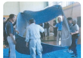
ワンタッチパーテーション 組立作業

安茂里地区全区長、防災指導員、安全部会員を対象とした防災力の向上を目的とした研修が開催され地域の防災力の向上に努めました。