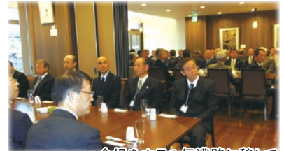
会場をホテル信濃路に移して開催された新旧役員の懇親・送別会

また、平成31年2月には第3期安茂里地区まちづくり計画（令和3年～令和7年）策定に向けプロジェクトチームを立ち上げました。これには社会の変化が激しい中、住民皆様の新鮮で柔軟な発想と行動力、人を支える優しい心、をこの安茂里地区の街づくりに生かしていかなければならないと考えております。