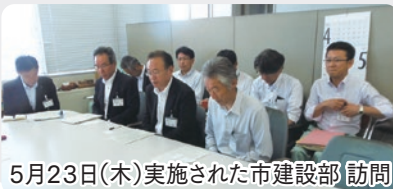
5月23日(木)実施された市建設部 訪問