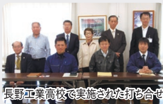
長野工業高校で実施された打ち合わせ

安茂里地区住民自治協議会は5月23日(木)長野市の建設部及び都市計画部に訪問し、例年実施している住自協の要望を提出する際長野工業高校からの要望も含め提出しました。今後早急に関係者に集まって頂き会議を開催する予定です。