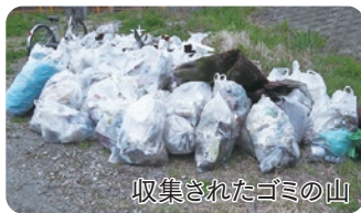
収集されたゴミの山

安茂里18地区環境部員47名が参加し、多少雨模様の天気の中犀川河川清掃が実施されました。今年は驚くほど例年以上にゴミが多く収集され、実施した効果があったと思います。