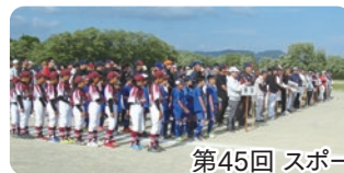
第45回 スポーツの祭典開会式

第45回目となるスポーツの祭典の開会式が好天に恵まれて犀川第一運動場で開催され、今年も裾花小学校のポプラマーチングバンドによる応援演奏で大会を盛り上げて頂き6月9日まで11種目のスポーツが実施されます。今年度から地域間交流に対する市の補助金制度は廃止されましたが、信更地区からはマレットゴルフチーム、小田切地区からはマレットゴルフ・ゲートボールチームが参加します。