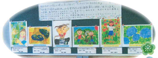
同時に展示された小学生の頃に描いた絵 (信濃教育会所蔵)

この式典の企画運営は新成人7人の運営委員により行われ、和やかに進みました。記念写真撮影の合い間には久しぶりに会った友達や恩師との会話で盛り上がり、華やかな着物姿が行き交い会場の雰囲気は最高潮に。祝宴はありませんでしたが、大勢の関係参加者に祝福され新成人として出発する皆さんにとって意義ある祝賀会でした。