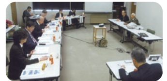
3月6日開催されたヒアリング、 寛実行委員長、事務局長出席

平成31年度もイルミネーション事業に標記補助金の獲得を目指し、寛実行委員長と小林事務局長が対応しました。長野市への申請補助額は、¥202,000（総事業費¥462,000）