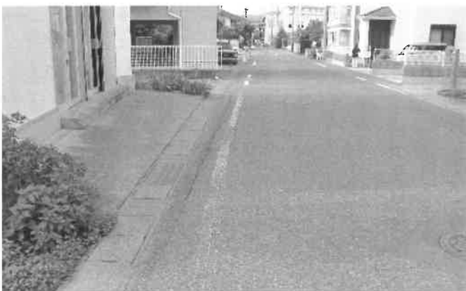
路側帯の白線が消えている区間

市職員との現地調査を行い、裾花中前のグリーンベルトの終了地点から長野工業高校前までの区間について引き直しを令和七年度に実施することになりました。カーブミラーの設置要望