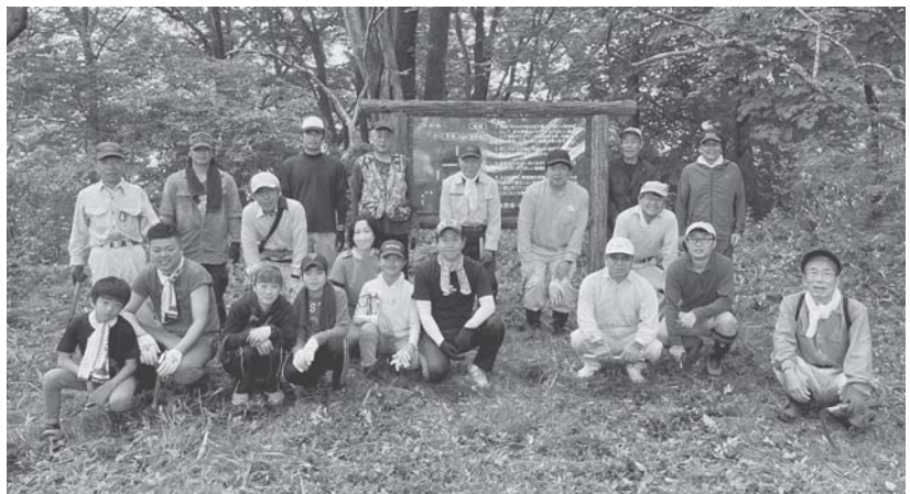
朝日山遊歩道 草刈り

風が吹けば倒木・枝折れの知らせで東へ行き、雨が降れば、水漏れの電話で西に出向き、道に穴がみつければ南へ顔を出し、