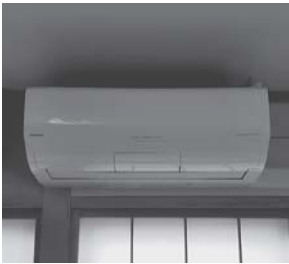
エアコンつきました

『交通安全教室』と『防災対策講座』では、参加者は少なく残念でしたが、講話を聴き知識として覚え、更に実際にやってみることに、いざというときに役に立つものと感じました。そして、この